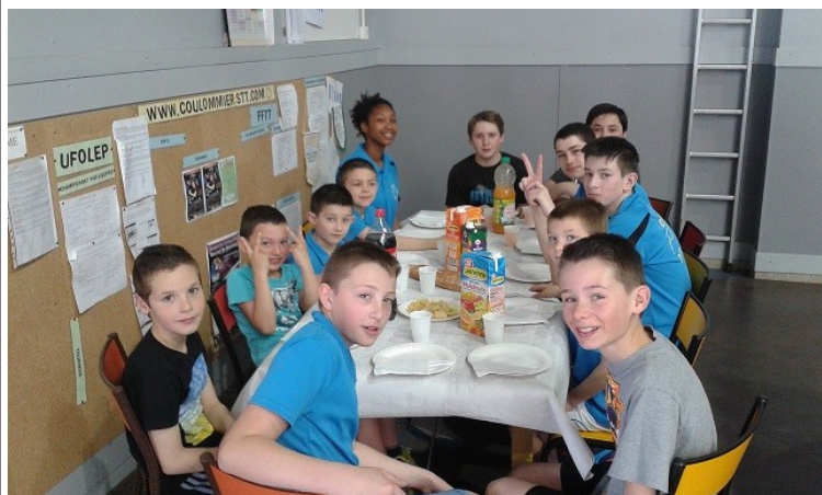
L'ensemble des participants autour d'un délicieux goûter

Les 18 et 19 avril ont eu lieu un stage pour les jeunes, dirigé par Tomtom. Encore une fois beaucoup de jeunes ont participé et ont pu évoluer dans leur technique de jeu, grâce aux précieux conseils du coach.