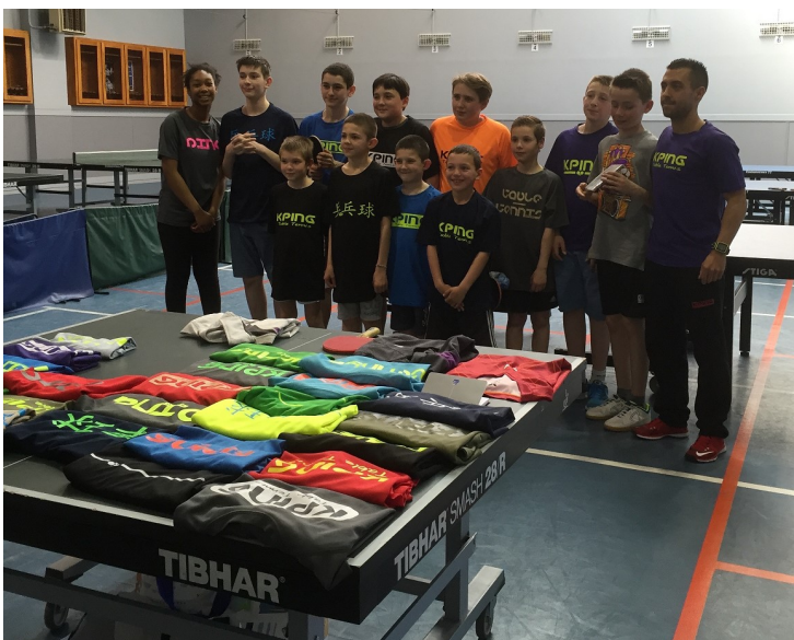
à droite : avec le coach Tomtom.